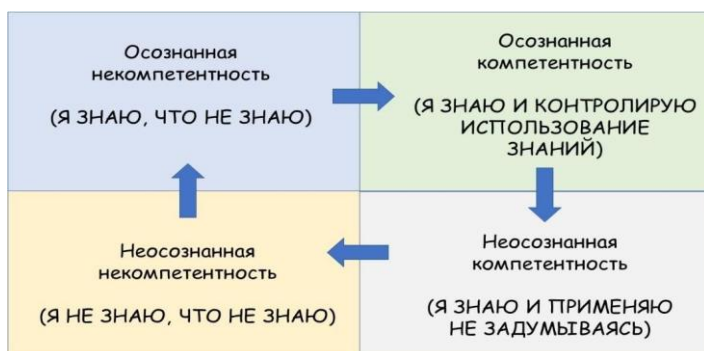
Рис. 2. Переход от бессознательной некомпетентности к бессознательной компетентности

Бессознательная некомпетентность. При бессознательной некомпетентности вам неизвестно, что вы не знаете или не умеете делать чего-либо («я не знаю о том, что я не знаю»). В нашем случае новый сотрудник еще не осознал дефицит собственной компетентности. Так, ребенок при путешествии с родителями в машине осознает факт путешествия, но не понимает при этом, что он не умеет водить, то есть остается в неведении насчет собственной некомпетентности.